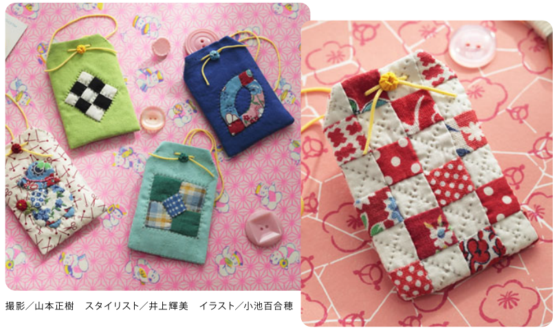
スタイリスト/井上輝美 イラスト/小池百合穂